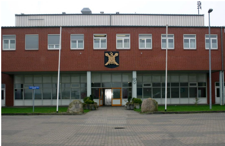
Hoofdgebouw 41 Hrstcie Mechbrig, legerplaats Seedorf aan het maj R.R. van Vels square. Boven de burelen; links en rechts van de ingang de werkplaatsruimtes.