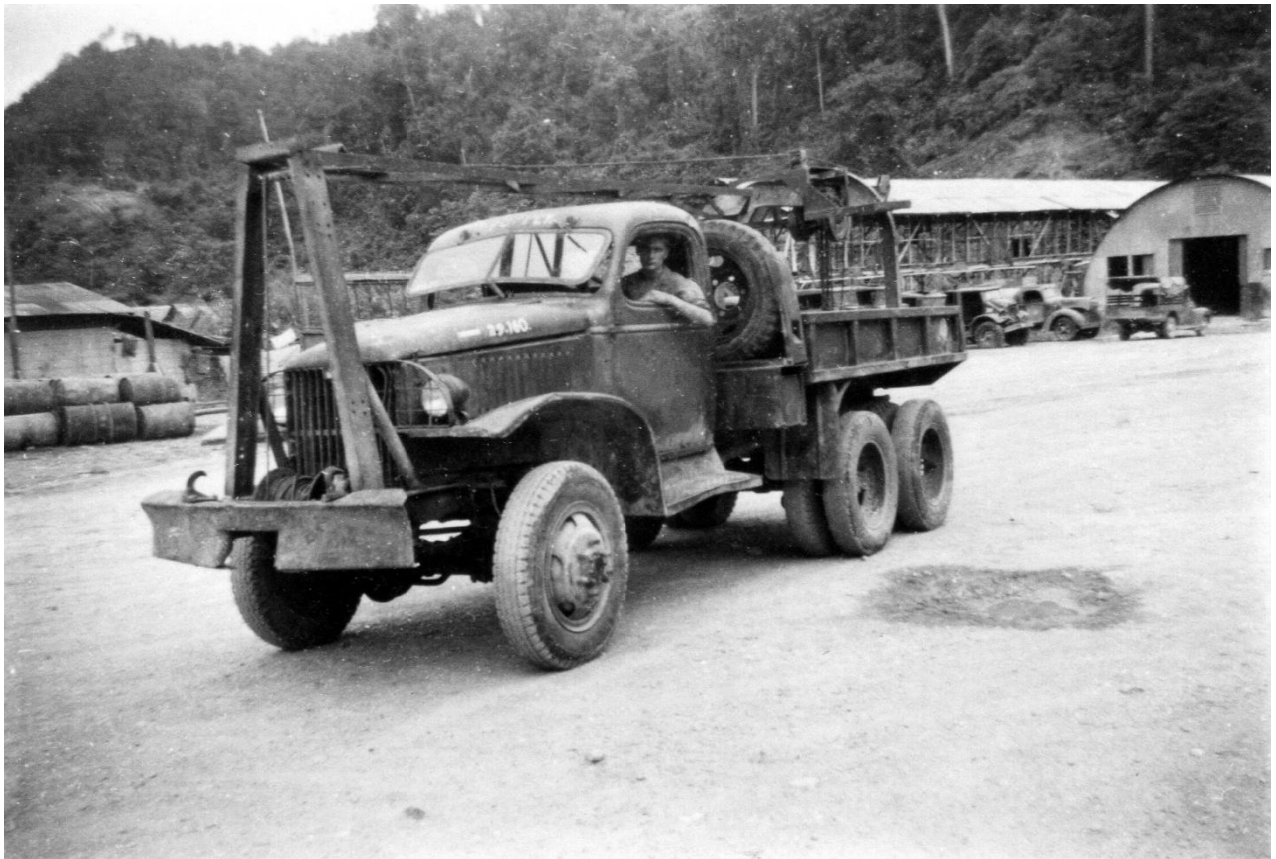
GMC CCKW bomtruck 2 ½ ton 6x6 met geïmproviseerde voorsteun om het ophijzen van bommen te vereenvoudigen. Hollandia (Nw.Guinea) medio 1949