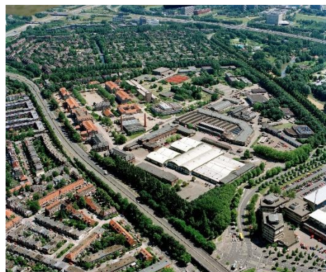
Luchtfoto Kromhoutkazerne 1999; links de waterlinieweg, rechts de Weg tot de Wetenschap. Het oude deel van de Kromhoutkazerne behoort tot de Universiteit van Utrecht.

Het gedeelte van 575 TDCtrwkpl en de instructiehallen heeft plaatsgemaakt voor de nieuwe Kromhoutkazerne.