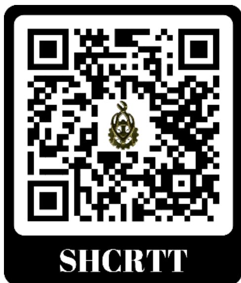
QR-code website HCRTT

Al met al een minder roerige tijd, maar die wel gebruikt is om onze collectie nog beter ten toon te stellen waardoor wij nog beter in staat zijn u de roerige en uitgebreide historie van ons Regiment te tonen. Wij nodigen u uit om langs te komen en de hele collectie te aanschouwen. Wellicht ziet u hier en daar een omissie en heeft u nog iets om dit teniet te doen. Voor openingstijden en dagen verwijzen we u graag naar de gegevens in de aanbiedingsbrief van dit jaarverslag, onze website en facebook.