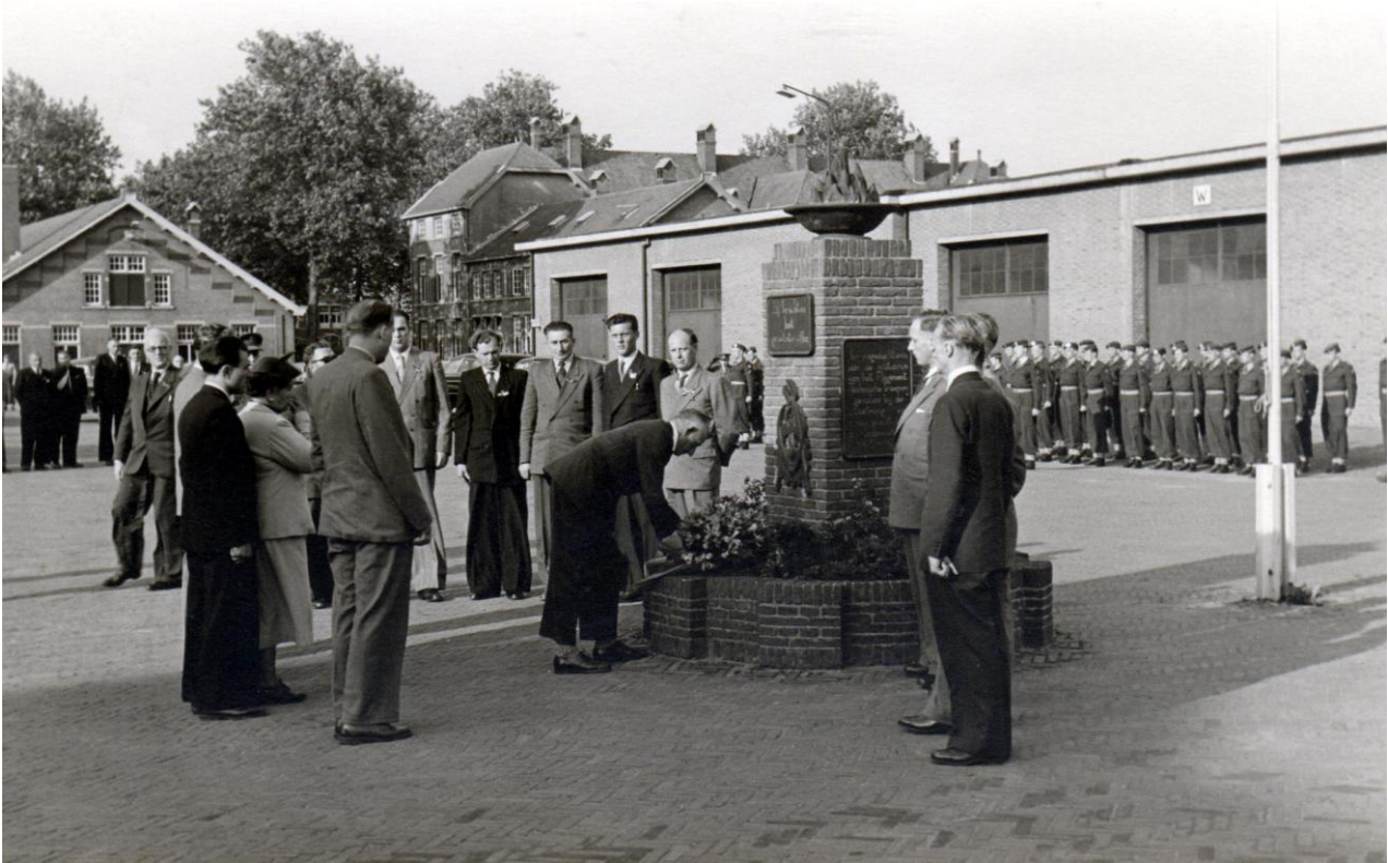
Dodenherdenking Regiment Technische Troepen op 16 juni 1953

Aan de uitvoering van het laatste punt zijn (bescheiden) kosten verbonden om het noodzakelijke gebruikersonderhoud aan de voertuigen uit te kunnen voeren en om de reiskosten van de vrijwilligers te betalen als de activiteit niet op een reguliere openingsdag plaatsvindt.