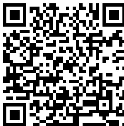
QR-code Facebook HCRTT