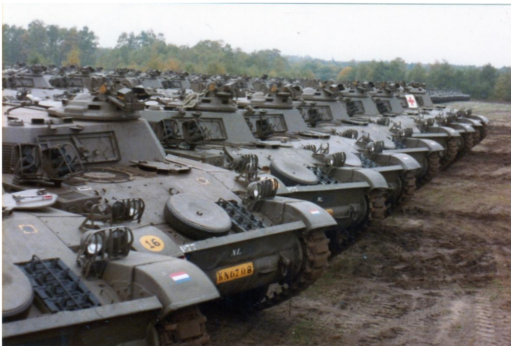
AMX'n op terrein 573 Verzamelplaats eind 1979 Sleutelwerk voor de liefhebbers?