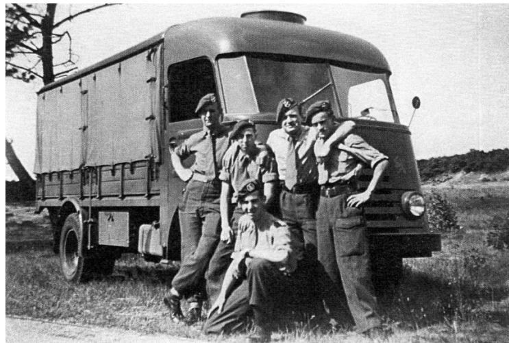
In 1949 werden een groot aantal DAF A30 ingereden door een aantal inrijpelotons met als standplaats Dumoulinkazerne. Na 2000 km volgde de overdracht aan de K.L. foto van een inrijpeloton.