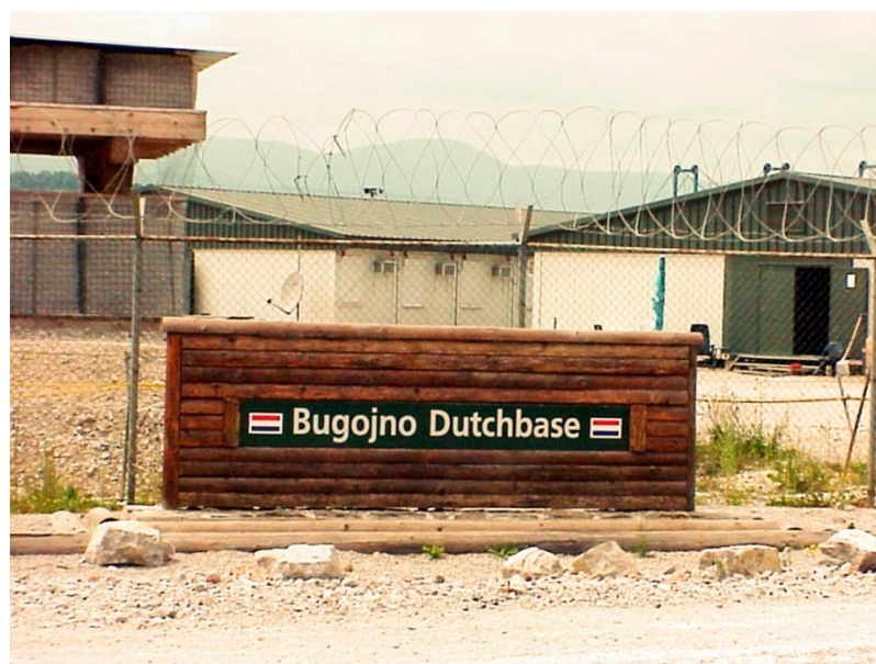
Ingang locatie Bugojno tijdens SFOR eind 2001