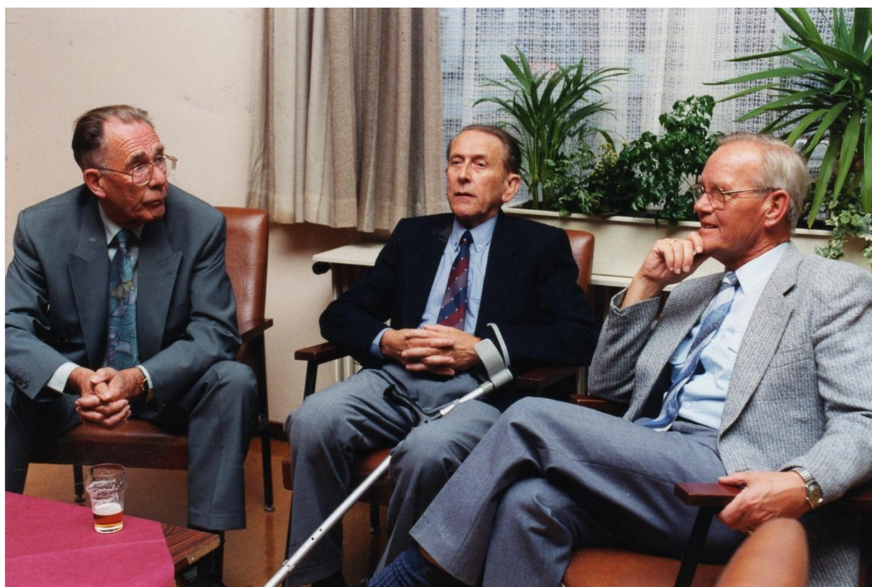
Werkoverleg tijdens een receptie op 27 september 1994