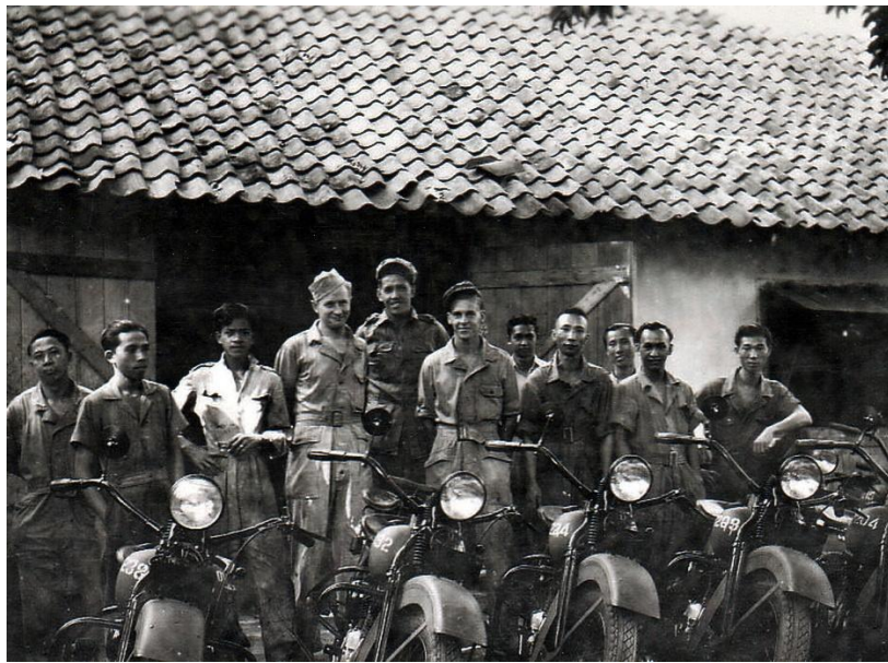
Motorfietsreparatiewerkplaats van hoofdwerkplaats LTD 80 Batavia 1947 met motoren Harley Davidson type WLA Liberator