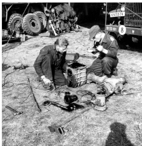
113 Lkhrstcie op oefening in september 1960 in Bramsche, Duitsland.