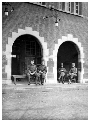
Wacht Kromhoutkazerne omstreeks 1925 met gasverlichting.